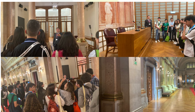
A visita guiada dos jornalistas

Os deputados do círculo eleitoral de Beja integravam a comissão 4 juntamente com os deputados dos círculos de Aveiro, Lisboa, Setúbal, Santarém, Viseu e de fora da Europa, enquanto os jornalistas e professores faziam uma visita guiada ao palácio de S. Bento.