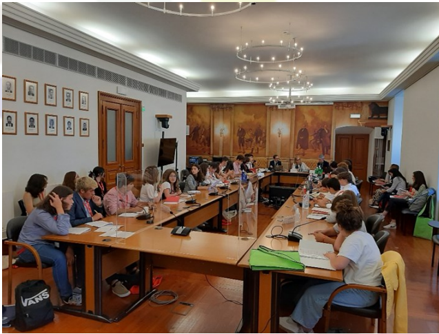
A comissão de trabalho em que ficaram os deputados do círculo eleitoral de Beja

Após a receção, reuniram-se as comissões de trabalho.