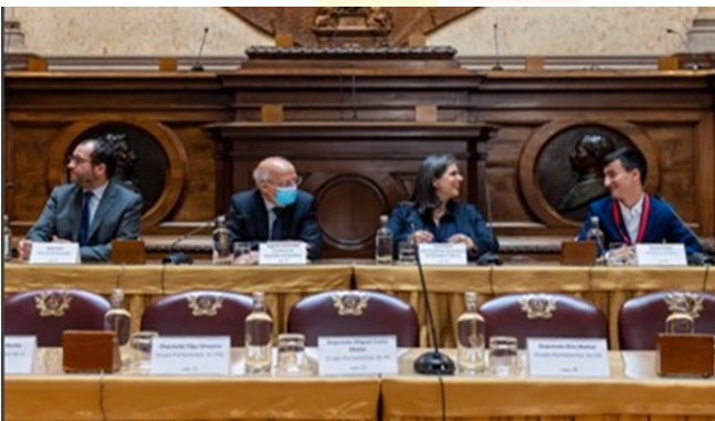
Da esquerda para a direita: Ministro da Educação, Presidente da Assembleia da República, Vice-presidente da Comissão da Educação e Ciência e presidente da Mesa

O Presidente da Assembleia da República, Augusto Santos Silva, inaugurou a sessão solene com um discurso de boas-vindas e enalteceu a participação no exercício da cidadania democrática demonstrado pelos jovens deputados, para além de ter introduzido o tema “Fake news: que estratégias para combater a desinformação?” .