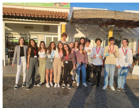
Foto de despedida dos deputados do autocarro 6, na Mimosa

foi uma experiência a não esquecer. Conhecer pessoas novas e fazer esta reportagem foram, sem dúvida, as suas partes favoritas.