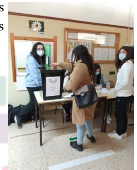
Pormenores do dia da eleição