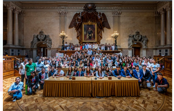
Foto de grupo com todos os participantes, Sala do Senado