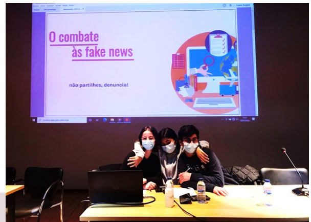
Os três candidatos da lista única envolvidos no debate