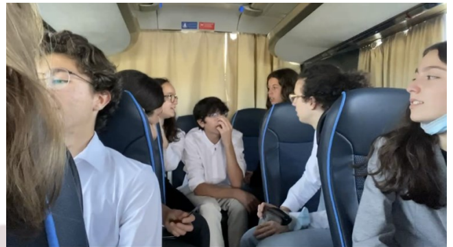
A bordo do autocarro 6 a caminho de Lisboa

A meio do caminho apanhamos os deputados do Colégio de Nossa Senhora da Graça, de Milfontes e de Sines.