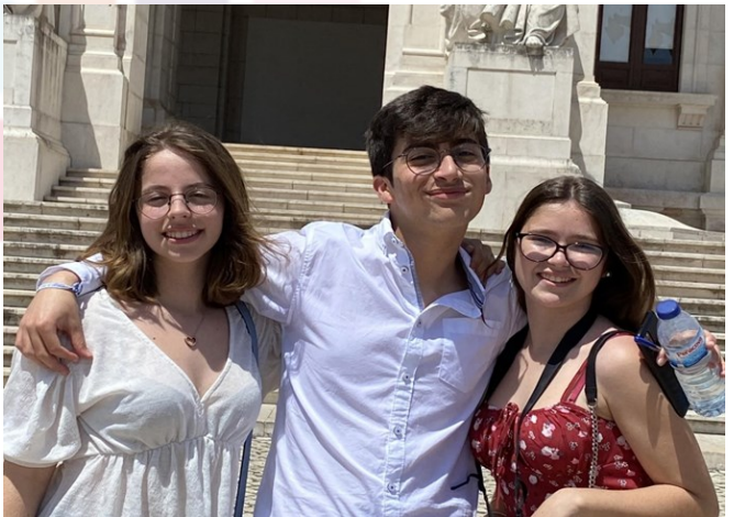
Os jovens deputados e a repórter de Ourique na chegada à Assembleia da República

A chegada à Assembleia da República foi marcada por uma receção e uma refeição leve oferecida pela organização do evento.