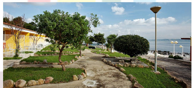
INATEL de Oeiras

Depois do jantar, as delegações foram para as unidades hoteleiras que lhes foram atribuídas, tendo a delegação do círculo eleitoral de Beja ficado alojada nas instalações do INATEL de Oeiras, onde os jovens