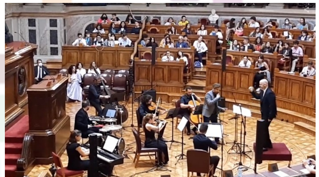
Atuação da Lisbon Film Orchestra , no dia 9

Para encerrar o primeiro dia de trabalhos, houve um momento cultural animado pela Lisbon Film Orchestra , após o que a organização agradeceu todos os presentes com um jantar volante.