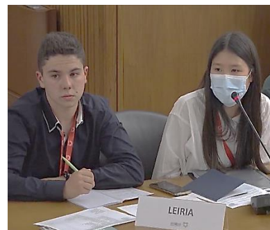
Em Comissão e em Sessão Plenária. Vários ambientes, o mesmo trabalho.

Concluído o primeiro dia de trabalhos, os jovens deputados, cansados, puderam relaxar e divertir-se um pouco com uma bela atuação da Lisbon Film Orchestra, que tocou música de filmes como O Rei Leão, Aladino e Pocahontas. Após o maravilhoso concerto, os jovens foram jantar e partilhar as suas experiências, criando amizades num ótimo ambiente de convívio, aumentado pela simpatia do staff do Palácio de São Bento.