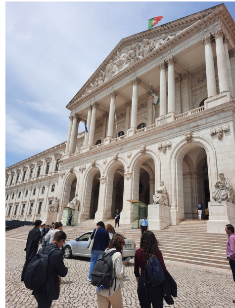
Chegada à AR

Os deputados foram separados em comissões para defenderem e debaterem as propostas de cada distrito.