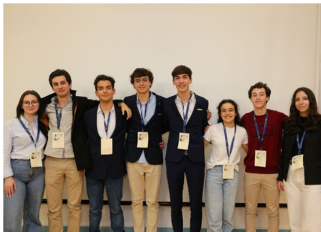
Deputados do Círculo de Leiria