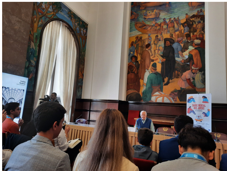
Conferência de Imprensa

Os jornalistas tiveram a oportunidade de participar numa conferência de imprensa com o simpático deputado que preside à Comissão Parlamentar de Educação e Ciência, Alexandre Quintanilha. Este deu espaço a perguntas por parte de todos, respondendo do modo mais honesto e franco possível. Entre conversas e contos de histórias da sua vida, esta conferência de imprensa marcou muito todos os jornalistas e inspirou-os com a incrível história de vida e os feitos de Alexandre Quintanilha.