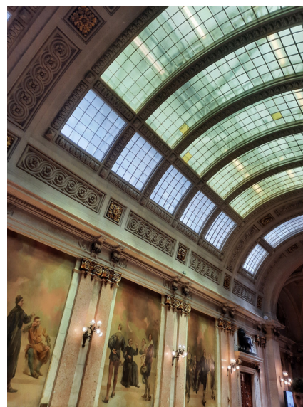
Sala dos Passos

Em cada comissão, é votado o projeto de recomendação a ser apresentado no dia seguinte, na sessão plenária.