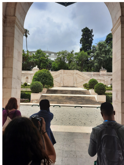
Exterior e Jardim