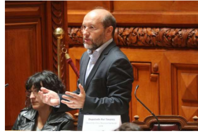
Deputado Rui Tavares Representante do Livre