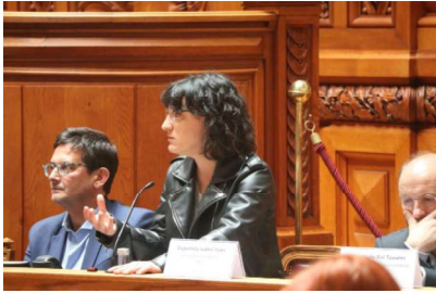
Deputada Isabel Pires Representante Grupo Parlamentar BE