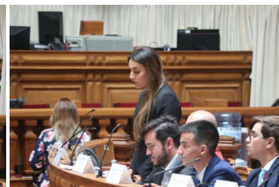
Deputada Rita Matias Representante Grupo Parlamentar Chega