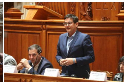
Deputado Rui Rocha Representante Grupo Parlamentar IL