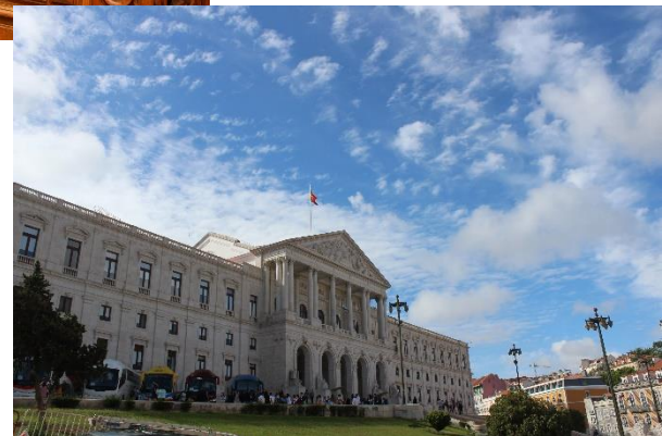
Parlamento dos jovens Prémio Reportagem /Beatriz Pereira