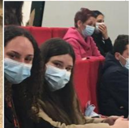
Parlamento dos jovens Prémio Reportagem /Beatriz Pereira