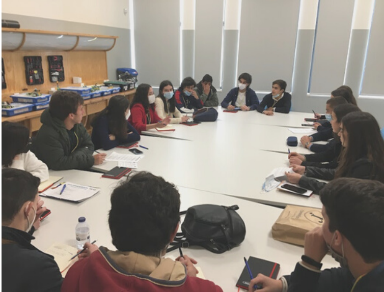
ALUNOS TRABALHAM EM COMISSÕES, GRUPO 1