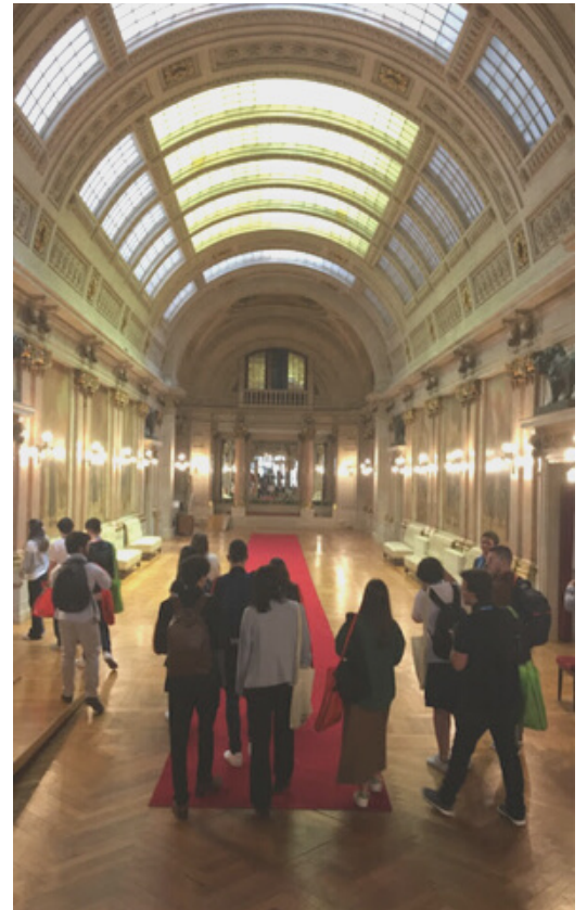
SALA DOS PASSOS