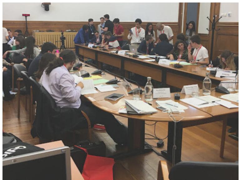
DEBATES NA QUARTA COMISSÃO