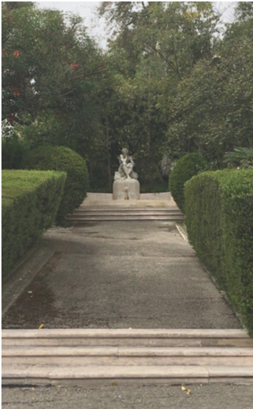
JARDIM DA ASSEMBLEIA