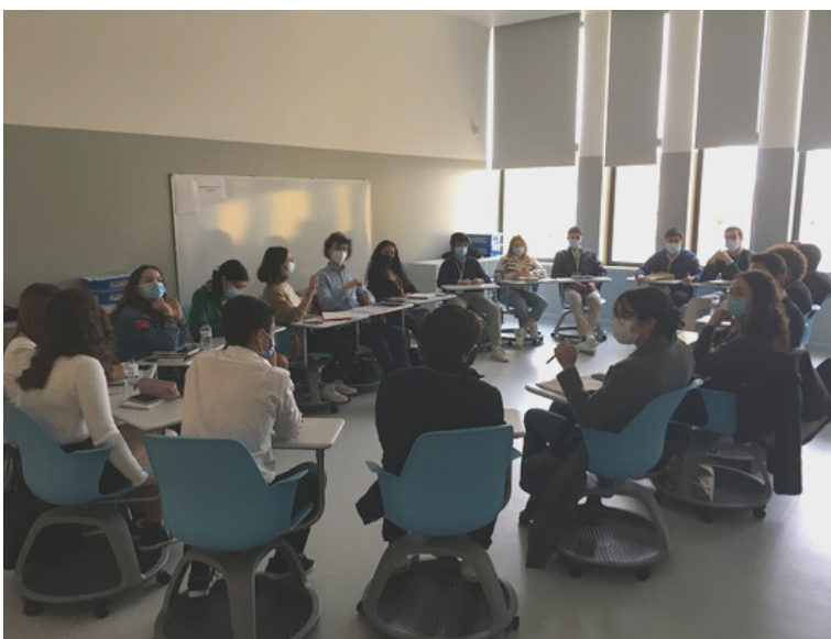
ALUNOS TRABALHAM EM COMISSÕES, GRUPO 2