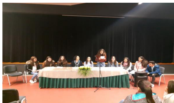
Debate do dia 10 de janeiro de 2017

Trabalhamos arduamente, definindo medidas e argumentos aceitáveis. Divulgamos as nossas medidas e respondemos a todas as questões que nos colocavam acerca das mesmas, apelando e incentivando o nosso eleitorado ao voto. Foi realizado um debate no dia 10 de janeiro, com a presença de alunos de todas as listas e com o objetivo de apresentação das medidas, promoção do debate entre os elementos das várias listas para esclarecimentos das medidas e preparação dos alunos para a Sessão Escolar, tendo os trabalhos deste debate decorrido nos termos indicados no Regimento do Projeto. Estava ainda prevista a realização de um segundo debate com um Deputado da Assembleia da República, o qual foi cancelado em virtude dos dias de luto nacional decretados pela morte do Dr. Mário Soares.