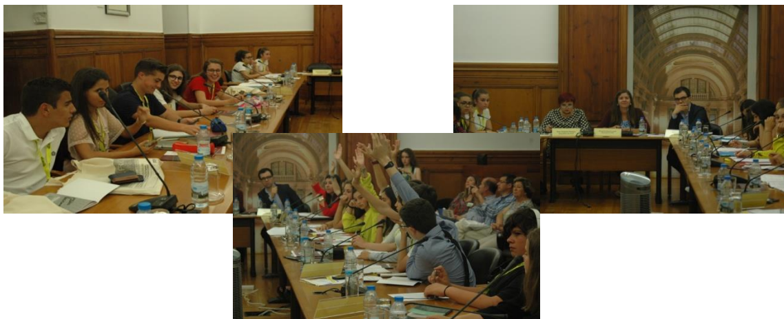
Trabalhos desenvolvidos na primeira comissão

Os trabalhos foram iniciados depois da hora de almoço, as deputadas ocuparam os devidos lugares na primeira comissão em representação do círculo do Porto. Discutiuiu-se e votou-se o Projeto de Recomendação, registando-se como vencedor o projeto da Madeira, com as respetivas alterações feitas pela comissão.