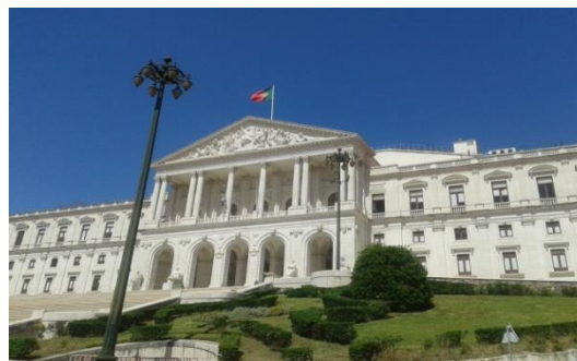
Assembleia da República

Finalmente, chegaram os grandiosos dias e as nossas três aventureiras puderam vivenciar o que é estar na Assembleia da República e sentir todo o rigor e respeito que nos suscita este monumento, que representa o maior órgão legislativo do nosso país.