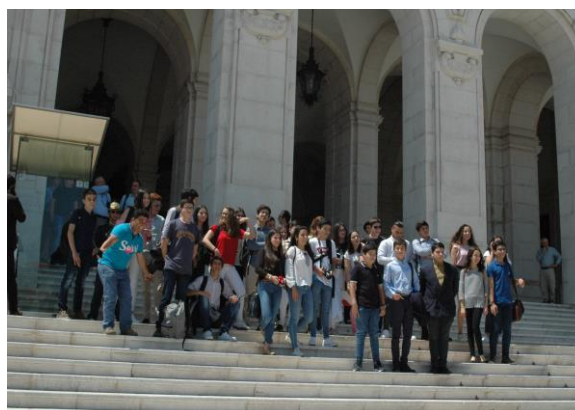
Momentos da Sessão Nacional

Esta aventura chegou ao fim, mas poderá ser o início de muito!