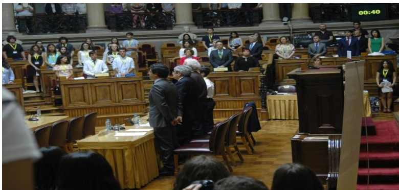
Abertura solene do Plenário

No dia seguinte, acordaram cheias de energia para mais um dia de trabalho. As atividades na Assembleia da República iniciaram-se com a abertura solene do Plenário, feita pelo Presidente da Assembleia da República, Dr. Eduardo Ferro Rodrigues, que também se fazia acompanhar, entre outros, pelo Presidente da Comissão de Educação e Ciência, Dr. Alexandre Quintanilha.