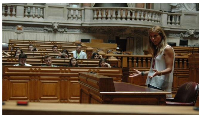
Visita guiada à Assembleia da República

Enquanto decorriam os trabalhos, os jornalistas realizaram uma visita guiada, durante a qual ficaram a conhecer a história da Assembleia da República, através da visita à sala dos Passos Perdidos e à sala principal onde decorrem as reuniões plenárias, e o modo de funcionamento das sessões.