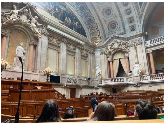
Visita à Assembleia da República