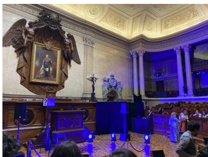
Sala onde foi realizado o espetáculo

Em seguida ao jantar, ainda servido nas instalações da Assembleia da República, fomos para o hotel “Star Inn” onde ficamos alojados e tivemos bons momentos de convívio.