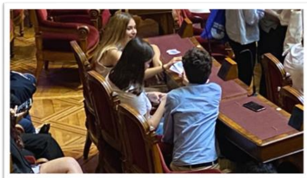
Jornalistas do círculo de Évora