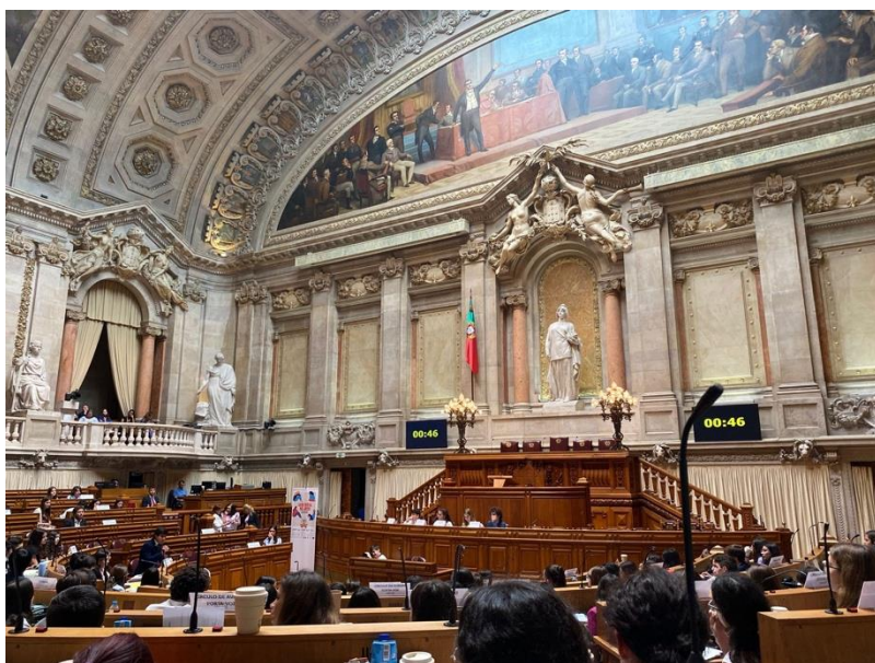
Última reunião do parlamento

Esta sessão terminou com o discurso da Sr. Presidente de mesa e dos restantes membros da mesa. Regressámos a Montemor-o-Novo por volta das 19:30h, e assim acabou, por este ano, o Parlamento de Jovens!