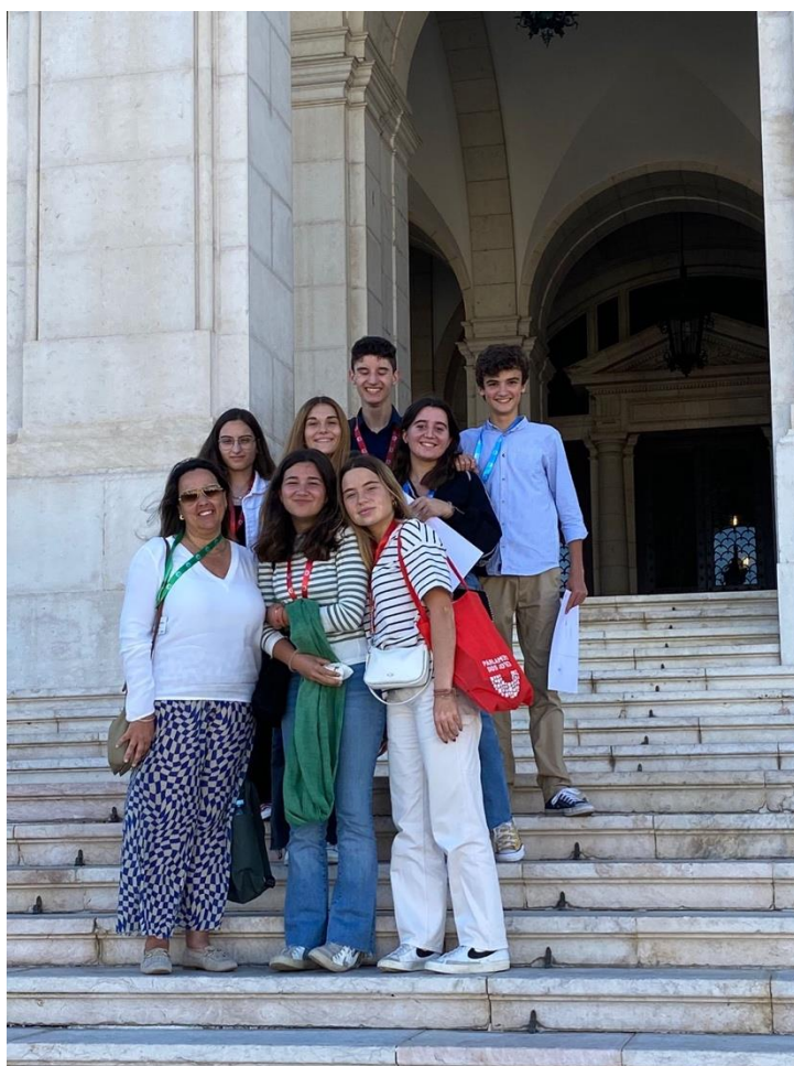
Representantes do círculo de Évora na saída da Assembleia

O Parlamento de Jovens foi sem dúvida uma experiência muito enriquecedora para todos os presentes e um projeto muito interessante que todos deviam de experienciar um dia.