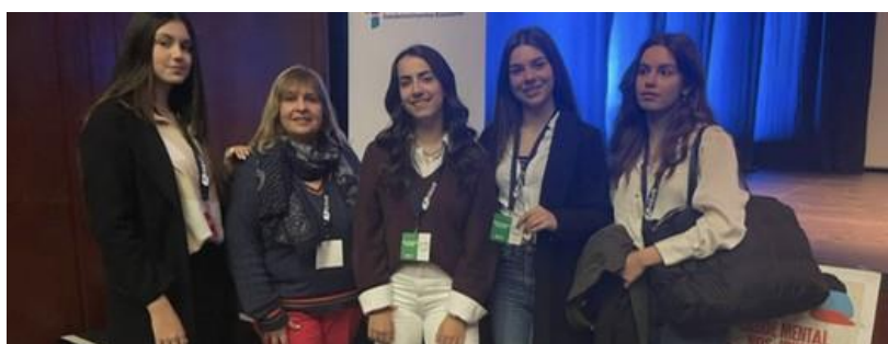
Deputadas da Escola Secundária Benavente

Gostei bastante de desempenhar o papel de Vice-Presidente de mesa da Sessão Distrital. Foi uma experiência enriquecedora que me permitiu contribuir ativamente para o funcionamento da sessão.