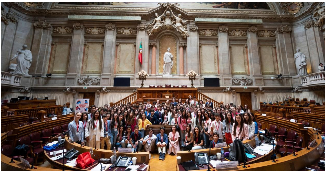
Participantes do Parlamento dos Jovens Ensino Básico (2023)