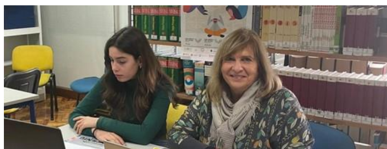
Eleição da Presidente de Mesa da Sessão Distrital