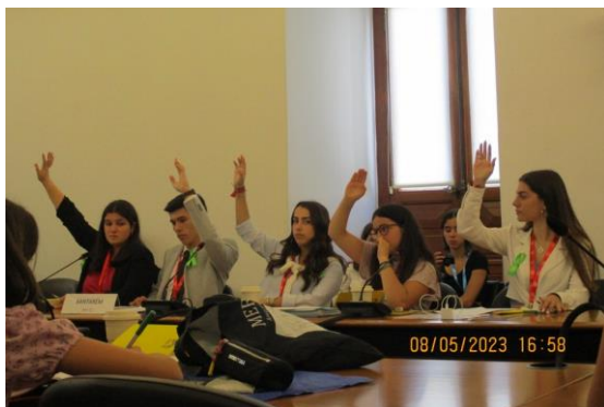
Círculo Eleitoral de Santarém na reunião da comissão

Nas Comissões Parlamentares foram debatidos os Projetos de Recomendação aprovados nos diversos círculos eleitorais e foi realizada a votação para o projeto-base. Foram igualmente selecionadas questões sobre diversas matérias a dirigir aos Deputados da Assembleia da República, no Plenário. Uma das questões escolhidas foi proposta pelo Círculo de Santarém. Os deputados do Círculo de Santarém estavam inseridos na 4.ª Comissão, da qual faziam igualmente parte os representantes dos círculos de Aveiro, Lisboa, Madeira, Portalegre e Porto. Nesta Comissão foram discutidas as diferentes medidas de forma a alcançar consenso, surgindo o Projeto de Recomendação Final.