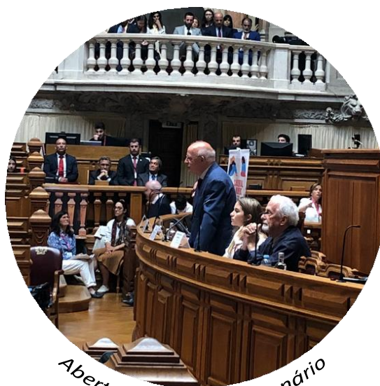
Abertura solene do Plenário