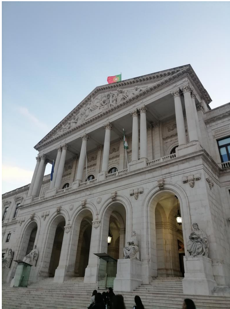
Assembleia da República, na “hora da despedida”

Encerro esta reportagem com uma frase do nosso ilustre escritor português Fernando Pessoa “Pedras no caminho? Guardo todas. Um dia vou fazer um castelo...”