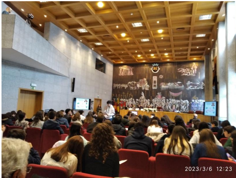
Momento de debate da sessão distrital (Carregal do Sal)

Às 13:00 interrompeu-se os trabalhos para o almoço.